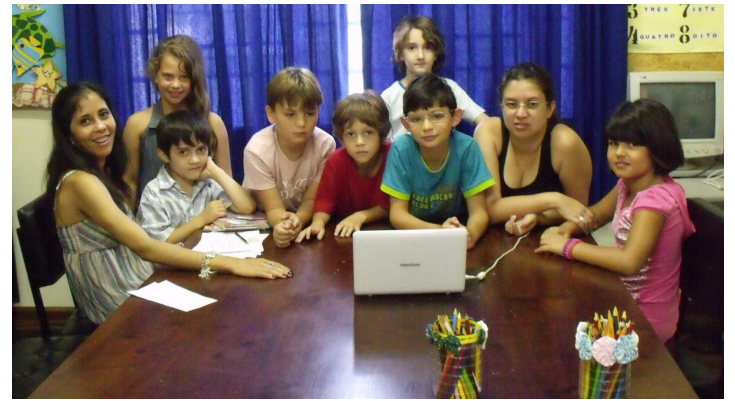
O DIJ aceita novos evangelizando durante todo o ano letivo. Traga suas crianças e jovens, dos 3 aos 21 anos de idade!