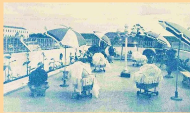
Fotos da Pupileira e solário em 1955