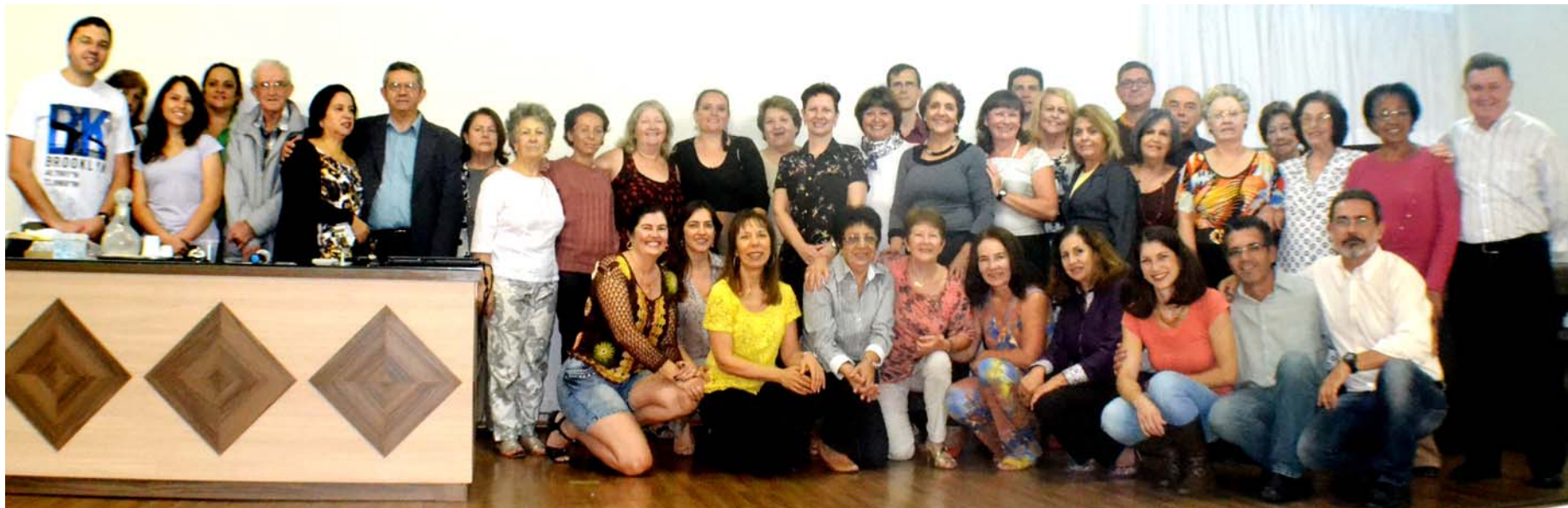
Alguns dos voluntários presentes posaram para a foto histórica de mais este aniversário da Casa, na noite do sábado, 11 de abril.